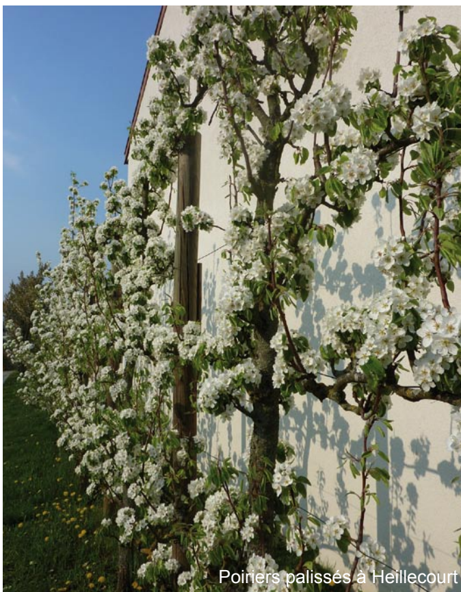
Poiniers palissés à Heillecourt

Contrairement à l'arbre isolé, cette implantation rapprochée de la façade permet l'usage de panneaux solaires et photovoltaïques en toiture ou en casquette au dessus du rideau d'arbres.