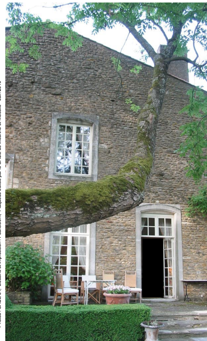
Dessins et impression : PealCoorn, Plaque éditée par le CAUE de Meurthe-et-Moselle - Juin 2010

L'art et la manière d'associer le végétal et les bâtiments dans une recherche de confort thermique