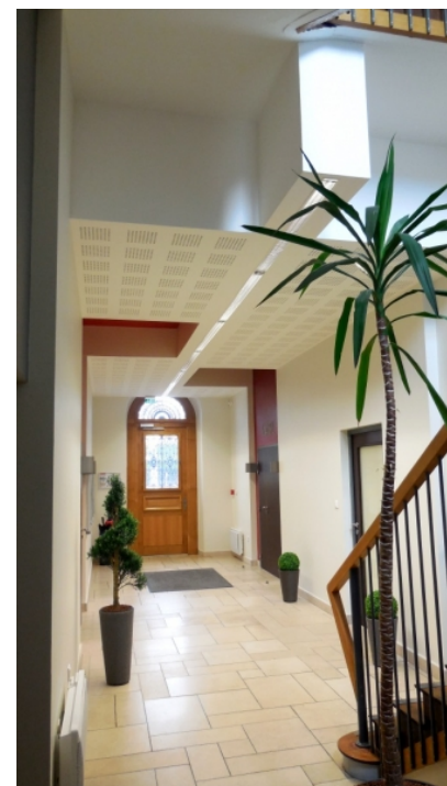
Hall d'accueil de la mairie et de la bibliothèque.

Coût de l'opération : 232 000 € HT (Valeur 2013)