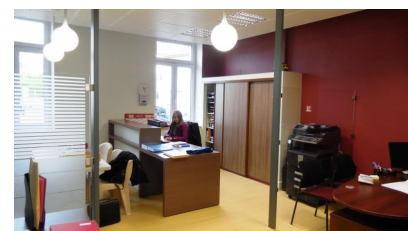
Bureau pour le secrétariat de mairie.