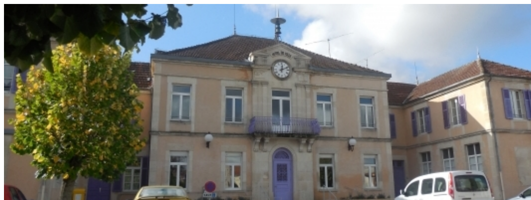
9 place Hôtel de Ville - Lérouville (1515 habitants)

La mise au normes d'accessibilité de la mairie a entraîné une réflexion globale sur le bâtiment. Le projet comprend la rénovation des locaux de la Mairie et l'aménagement d'une bibliothèque municipale avec un espace médiathèque.