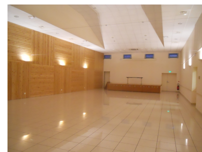
La salle pouvant recevoir jusqu'à 240 personnes.