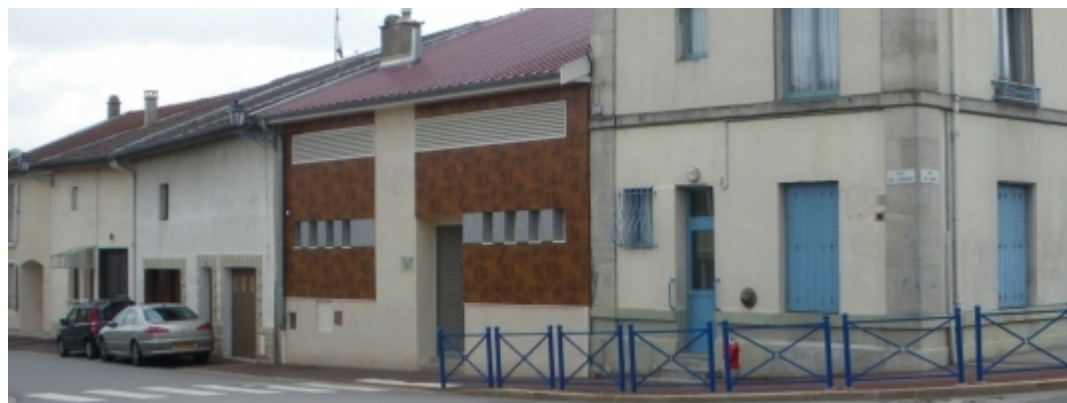
rue de l'Ornain - Velaines (964 habitants)

La rénovation de la salle des fêtes de Velaines s'intègre parfaitement dans le tissu urbain existant. Construite dès l'origine dans le même alignement que les bâtiments voisins, la mise en oeuvre d'une nouvelle façade sur la rue offre une touche contemporaine.