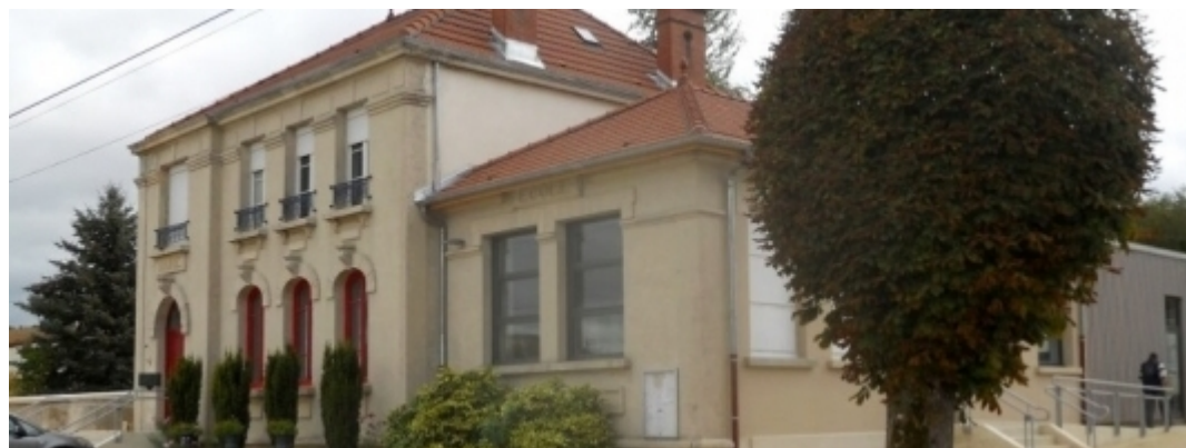
9 rue de l'église - Champneuville (125 habitants)

La commune s'est engagée sur un projet qui répond à un maximum de critères de Développement Durable et intègre une dimension sociale à travers la consultation des habitants. Les travaux concernent la rénovation et la restructuration de la mairie, ainsi que l'extension de l'ancienne salle des fêtes.