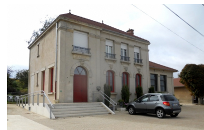
Escalier / rampe pour l'accessibilité à la mairie.

Coût de l'opération : 505 000 € HT (Valeur 2012)